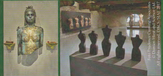
Foto: Providence Curating Associates © Damien Hirst and Science Ltd All rights reserved, DACS/SIAE 2017

DAMIEN HIRST Palazzo Grassi e Punta della Dogana, fino al 3 dicembre, www.palazzograssi.it (vedi Arte n. 525). È la mostra veneziana di cui più si parla quest'anno: Treasures from the wreck of the unbelievable è il "kolossal" di Damien Hirst (Bristol, 1965) suddiviso nelle due sedi della Fondazione Pinault . L'artista crea una vera e propria mitologia intorno alle sue nuove opere, che segnano un cambio nella sua estetica. La mostra è anticipata da due sculture visibili sul Canal Grande, all'esterno delle due sedi. (S. C.)